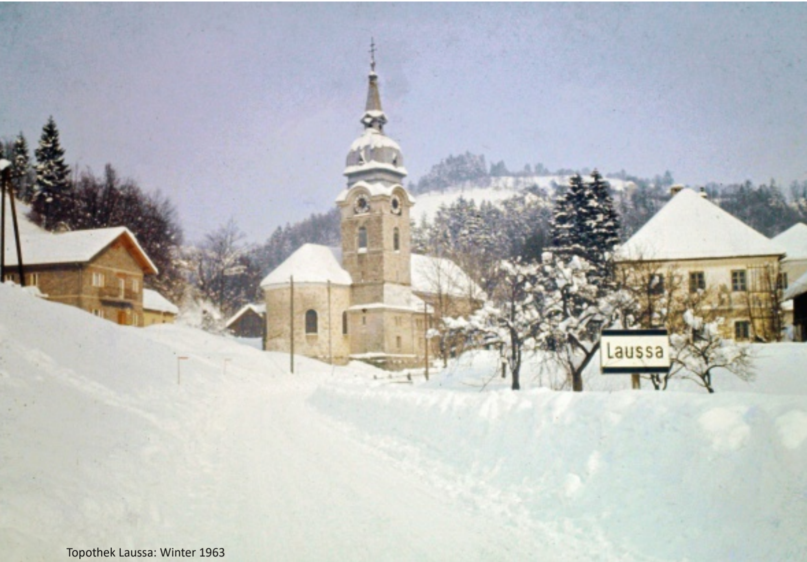
Winter 1963

Die Gemeinde Laussa wünscht eine besinnliche Weihnachtszeit und ein gutes Neues Jahr 2025!