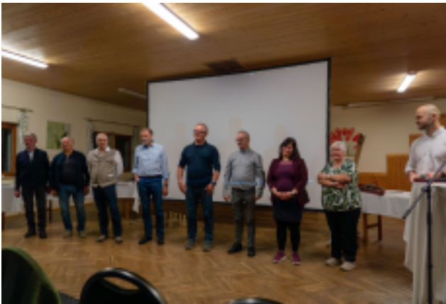
Die "Erzähler" beim Geschichtenabend

Rund 200 Besucher folgten der Einladung zum Laussinger Geschichtenabend. Laussingerinnen und Laussinger teilten dabei persönliche Erinnerungen und Anekdoten aus vergangenen Jahrzehnten und ließen gemeinsam ein Stück Ortsgeschichte lebendig werden.